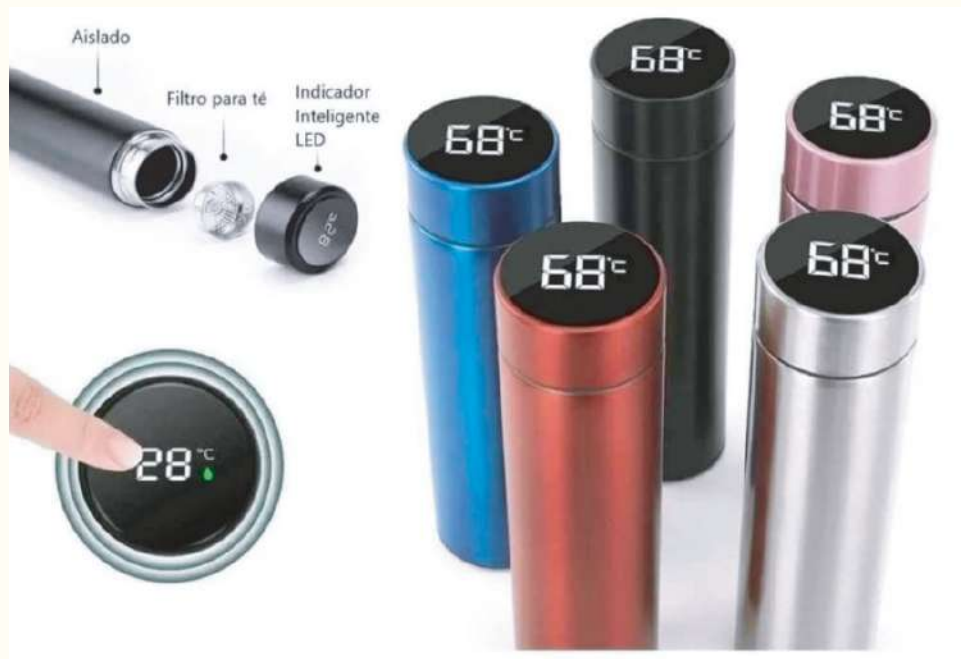
Termo con indicador electrónico Metalizado y con posibilidad de es- tampar marca