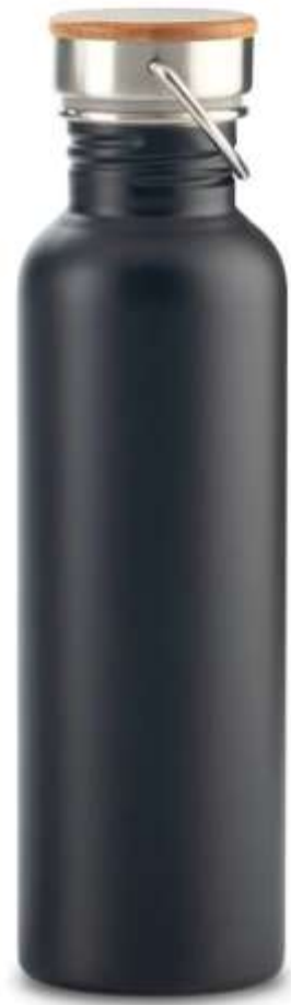
Botilito Metalico Wood700ml Acero inoxidable. Tapa rosca metálica con madera y agarradera metálica. Empaque caja individual.