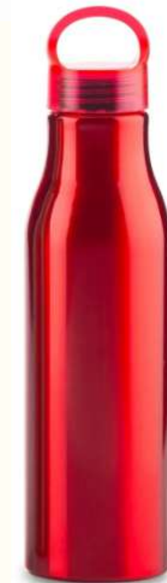
Botilito Metalico Barry 600ml Metálico. Con tapa rosca. Medidas:22.6 cm x 6.5 cm diámetro