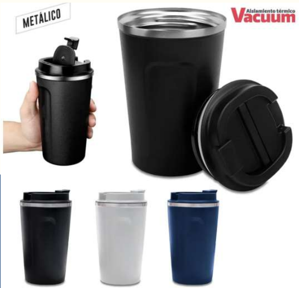
Mug Metálico Stabby 380ml Doble pared en acero Inoxidable, con aislamiento térmico que mantiene la bebida fría entre 8-10h aprox o caliente 3-4h aprox (puede variar dependiendo condiciones climáticas). Tapa plástica protectora de cierre de rosca. Empaque caja individual. Medidas: 14.5 cm x 8.7 cm diámetro superior .