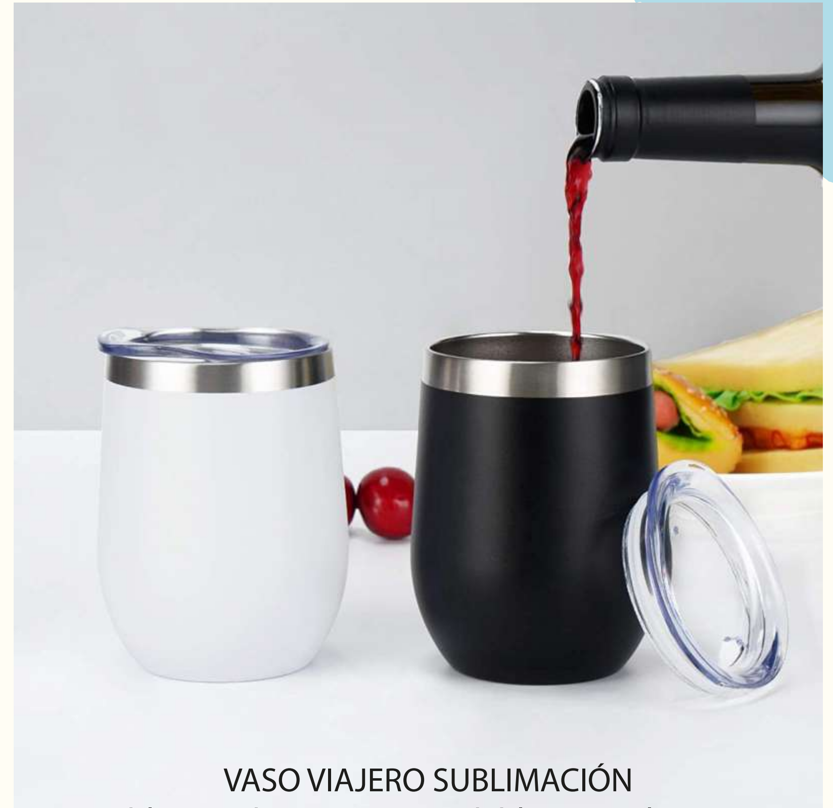
VASO VIAJERO SUBLIMACIÓN Doble pared en acero inoxidable con aislamiento térmico que mantiene la bebida fría entre 8 a 10 horas, o caliente 3 a 4 horas.