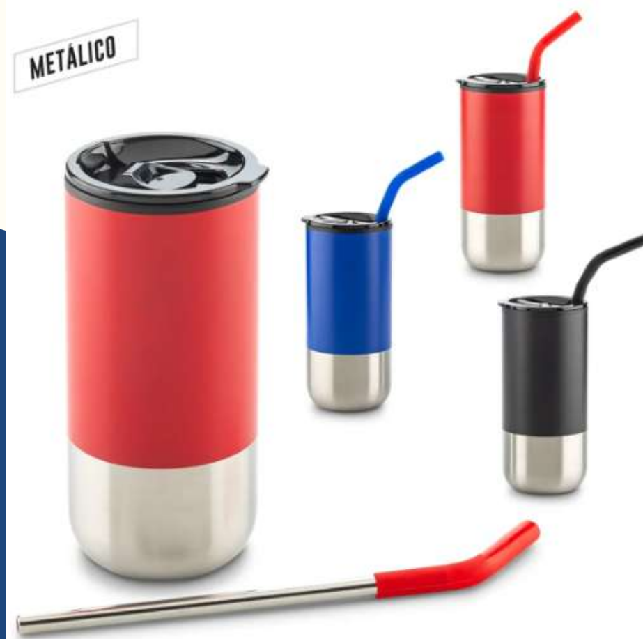
Mug Metálico con Pitillo 600ml Vaso de interior plástico y exterior en acero inoxidable, incluye pitillo metálico con boquilla superior en silicona. Empaque caja individual. Medidas: 17.5 cm x 7.5 cm diámetro Medidas:22 cm x 7 cm diámetro