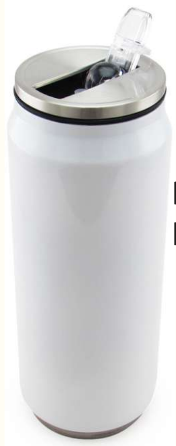
BOTILITO LATA PARA SUBLIMACIÓN Botilito para sublimación en forma de lata.