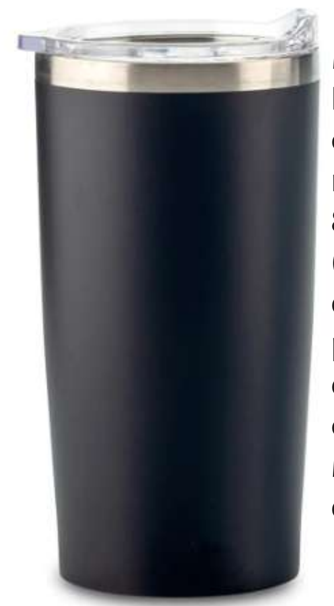
Mug Metalico Slash 360ml Doble pared en acero Inoxidable, con aislamiento térmico que mantiene la bebida fría entre 8-10h aprox o caliente 3-4h aprox (puede variar dependiendo condiciones climáticas). Tapa plástica protectora de cierre a presión, no es tapa de seguridad. Empaque caja individual. Medidas: 16.5 cm x 7.5 cm diámetro