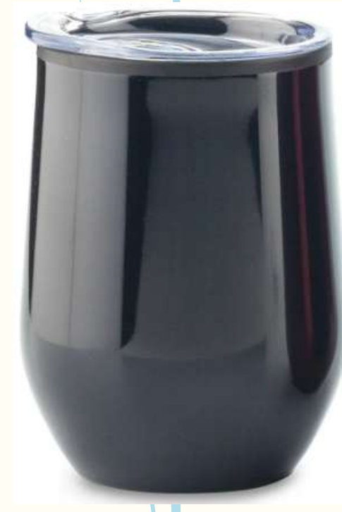
Mug Metalico Star 350ml Mug metálico con interior plástico y tapa. La tapa es una tapa protectora, no es tapa de seguridad. Empaque caja individual. Medidas:12 cm x 6.3 cm diámetro inferior Medidas:22 cm x 7 cm diámetro