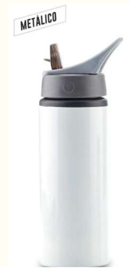
Botilito en Aluminio para Sublimación Parsons 750ml Botilito metálico con tapa pitillo. Medidas: 24 cm x 7.2 cm diámetro .