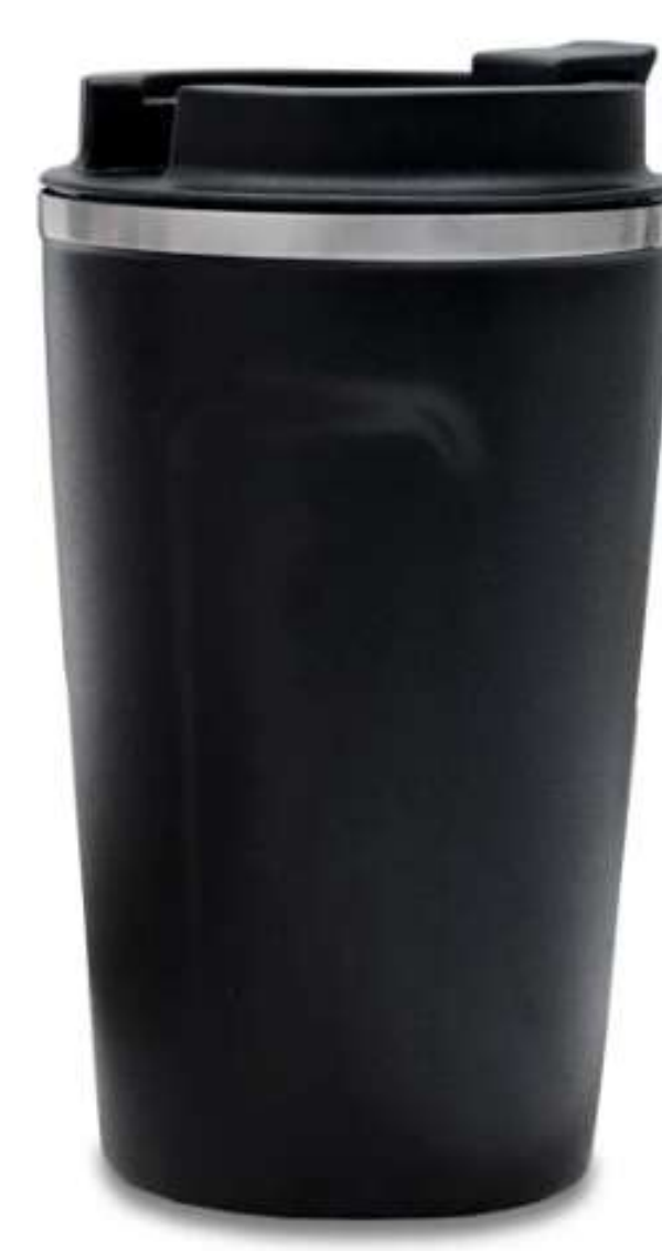
Mug Metálico Stabby 380ml Doble pared en acero Inoxidable, con aislamiento térmico que mantiene la bebida fría entre 8-10h aprox o caliente 3-4h aprox (puede variar dependiendo condiciones climáticas). Tapa plástica protectora de cierre de rosca. Empaque caja individual. Medidas: 14.5 cm x 8.7 cm diámetro superior .